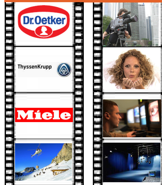
Phasen der Filmherstellung

Die drei Mu wurden im Produktionsprozess der Filmherstellung angewendet, der aus den Phasen Konzeption, Drehbuch, Dreh und Regie und Schnitt besteht.